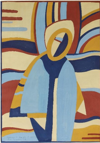
Площинне вирішення. Одягнений жіночий торс Гуаш, папір..