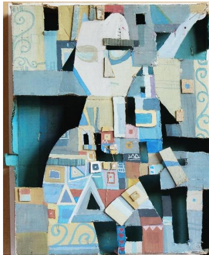
Контр-рельєф. Портрет. Фарбований картон, папір.