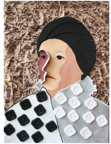
Колаж. Натурниця у береті. Папір, фарбований картон.