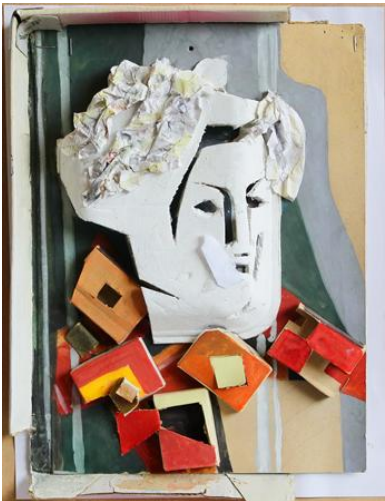
Рельєф та контр-рельєф. Портрет. Фарбований папір, пінопласт, картон.