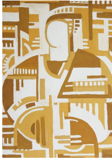
Площинне вирішення. Чоловіча напівфігура у нац. вбранні. Папір, гуаш