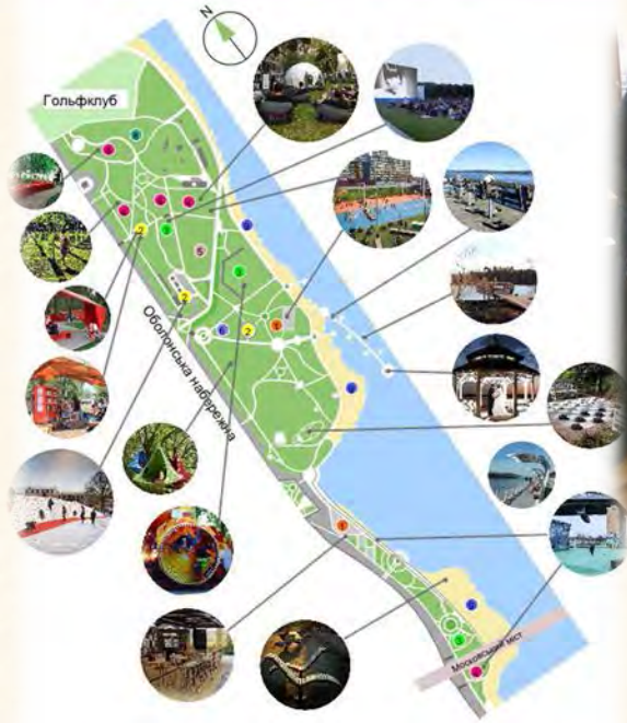
Експлікація до зонування: