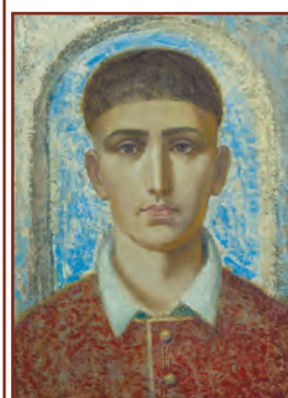
Григорій Сковорода. 2020. Полотно, олія. 39х27