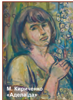
М. Кириченко «Аделаїда»