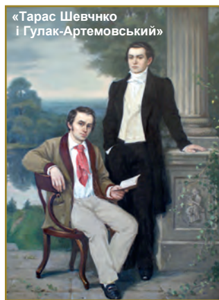
«Тарас Шевченко і Гулак-Артемівський»