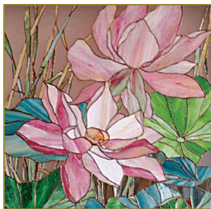
Робота В. Погорецької

P.S. Коли писалися ці рядки, прийшла сумна звістка про те, що відійшов в інший вимір батько Галини Василівни – народний художник України, професор Василь Іванович Забашта. Висловлюємо глибоке співчуття рідним і близьким покійного.