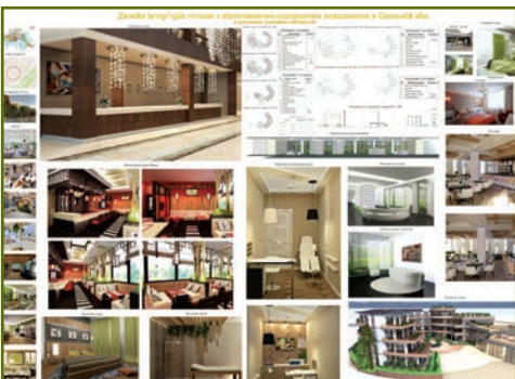
Я. Штапір. Дизайн-проект готелю в Одеській області