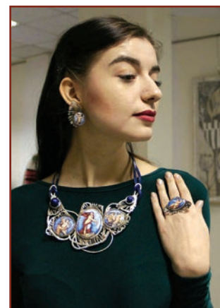
А. Яременко. Комплект ювелірних прикрас «Загадковість морських глибин»

Однак, слід зазначити, що не завжди наукова частина дипломної роботи була достатньо переконливою. Подекуди дипломникам бракувало знання останніх розвідок з обраної теми. Серед недоліків можна назвати також кілька випадків недостатньо професійної графічної подачі моделей одягу та вишивки, при тому, що робота в матеріалі була виконана на «відмінно». В окремих випадках подачі монументально-декоративних творів у контексті архітектурної ситуації протиставлялась масштабна невідповідність реального