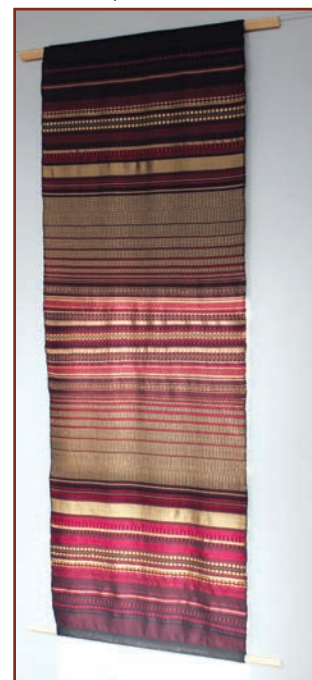
В. Сікорська. Декоративна тканина для одягу «Струни душі»