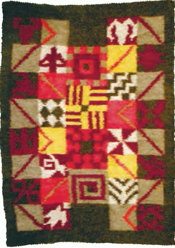
Життя знак. 2001

них триптих-гобелен «Щастя» (палац урочистих подій Дарницького району м. Київ), завіси «Музика» та «Урочиста» (Хмельницька обласна філармонія), гобелен-триптих «Гімн праці» (музей трудової слави Гіталова на Кіровоградщині), мозаїка