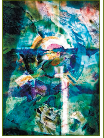
Сонце заходить. 1994