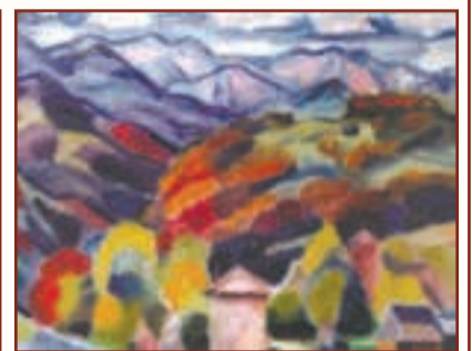
Іван ГУПІК