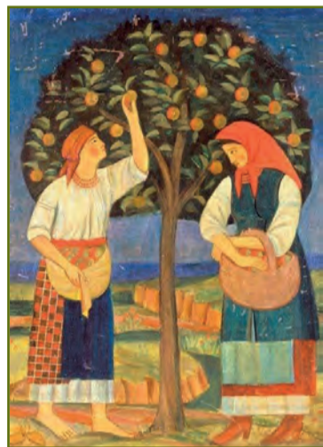
Тимко Бойчук. Біля яблуні. Картон, темпера. 54 x 40 см. 1919-1920 р.