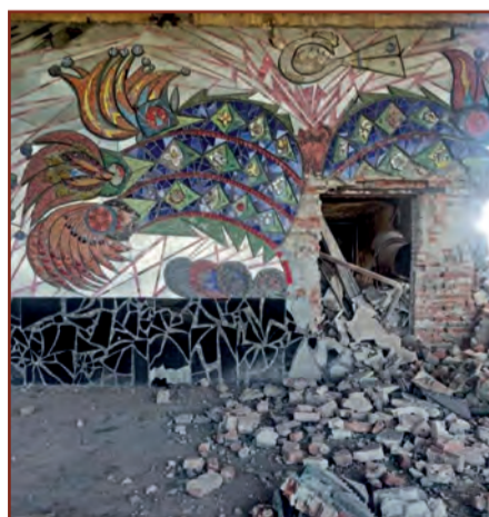
Рис. 6. Мозаїчне панно «Дерево життя» після руйнування.