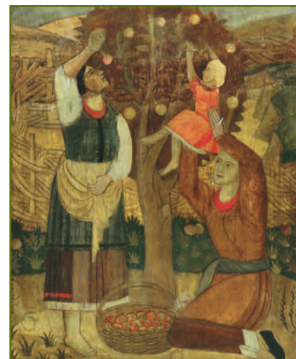
Микола Рокицький. Біля яблуні. Дерево, темпера. 68 x 54 см. 1928 р.