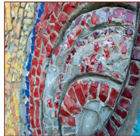
Рис. 2. Пошкоджений фрагмент мозаїки «Прометей».