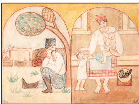
О. Саєнко. Чоловік у полі. Жінка в хаті. 1920. Папір, акварель.