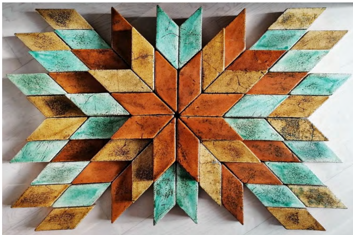
Рис. Е.2. Н. Хананова. Робота в матеріалі