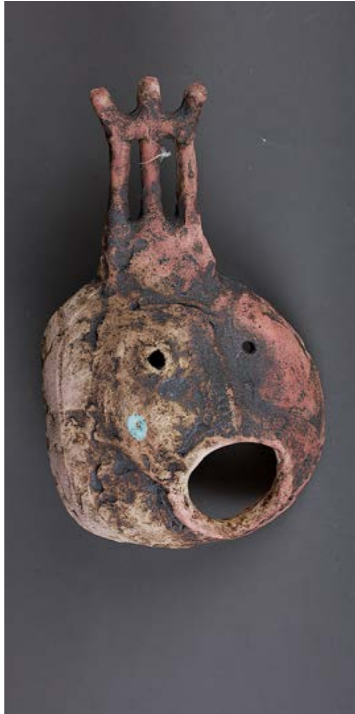
◀ ▶ Світлана Шоломіцька дипломна робота (фрагменти), шамот, поливи, ліплення