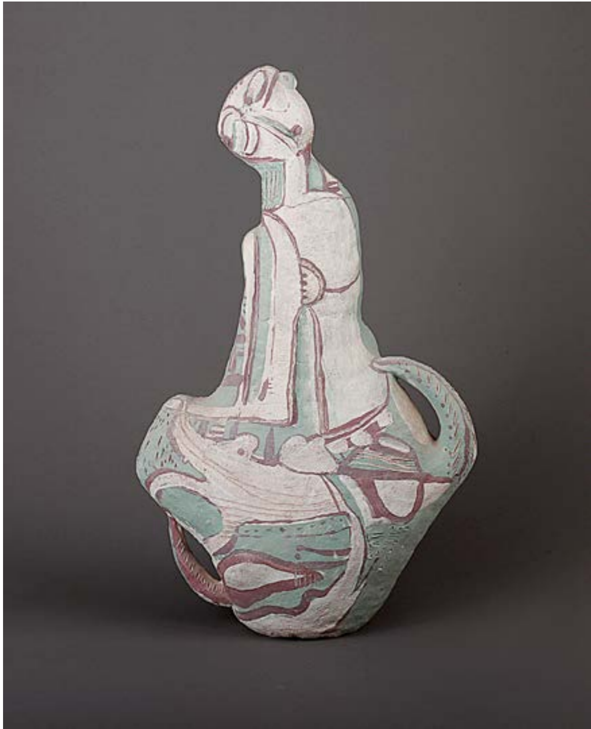
Юлія Козятник курсова робота, шамот, ангоби, ліплення