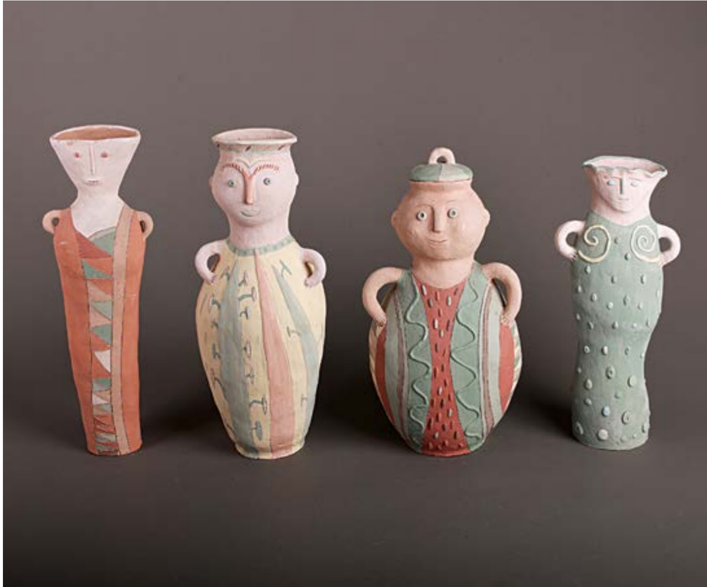
Анастасія Косяченко курсова робота (фрагменти), шамот, ангоби, ліплення