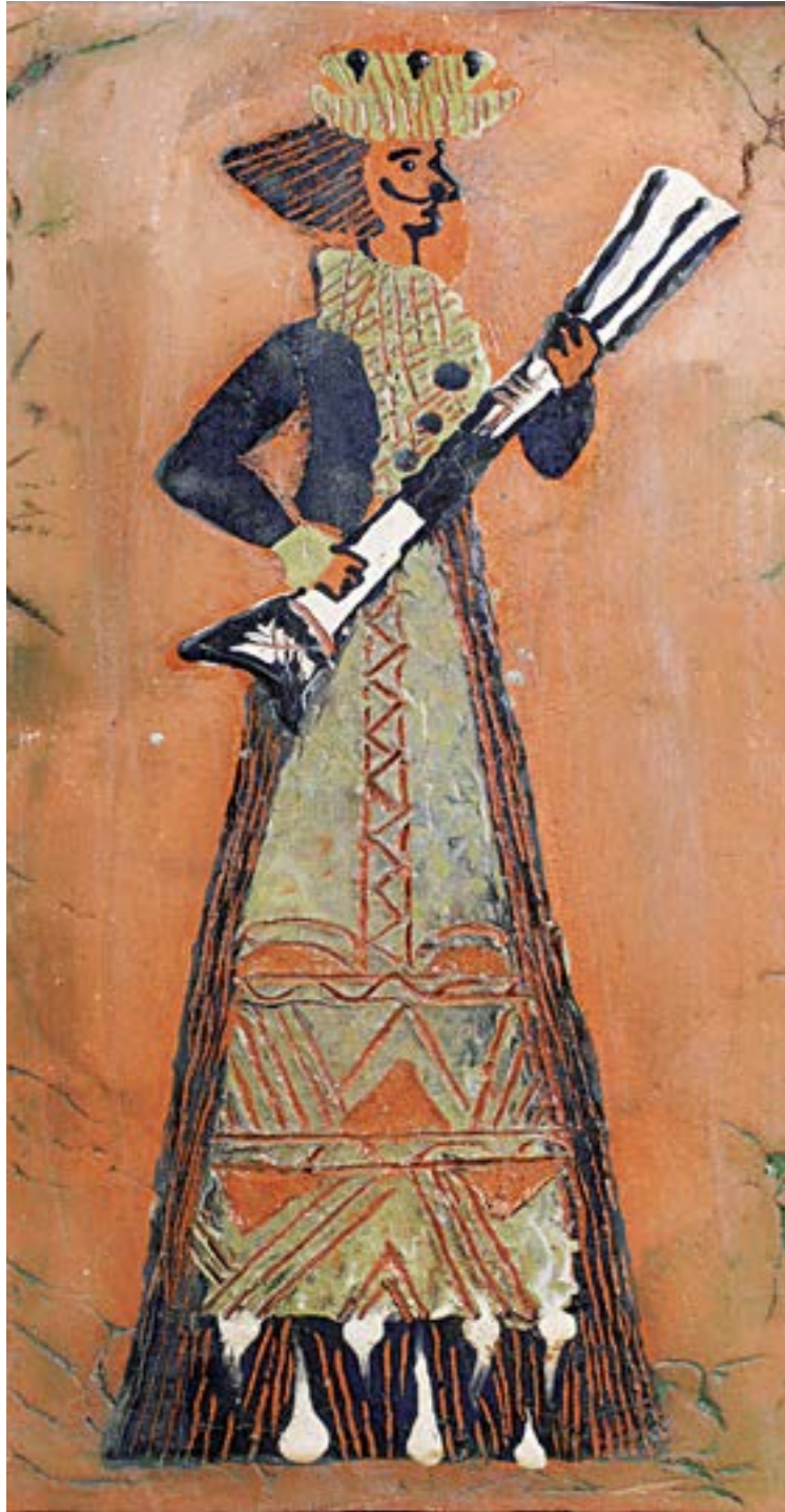
Інна Власенко курсова робота, шамот, ангоби, поливи, ліплення