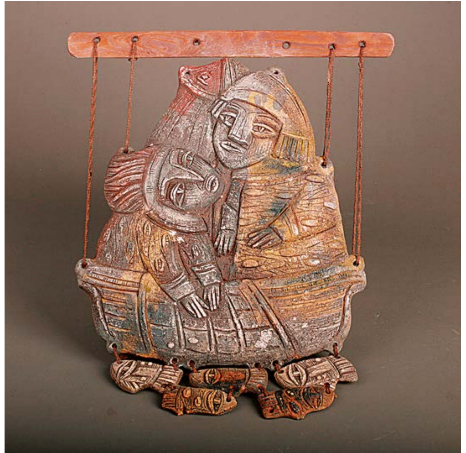
▶ Дмитро Шинкаренко шамот, ангоби, ліплення