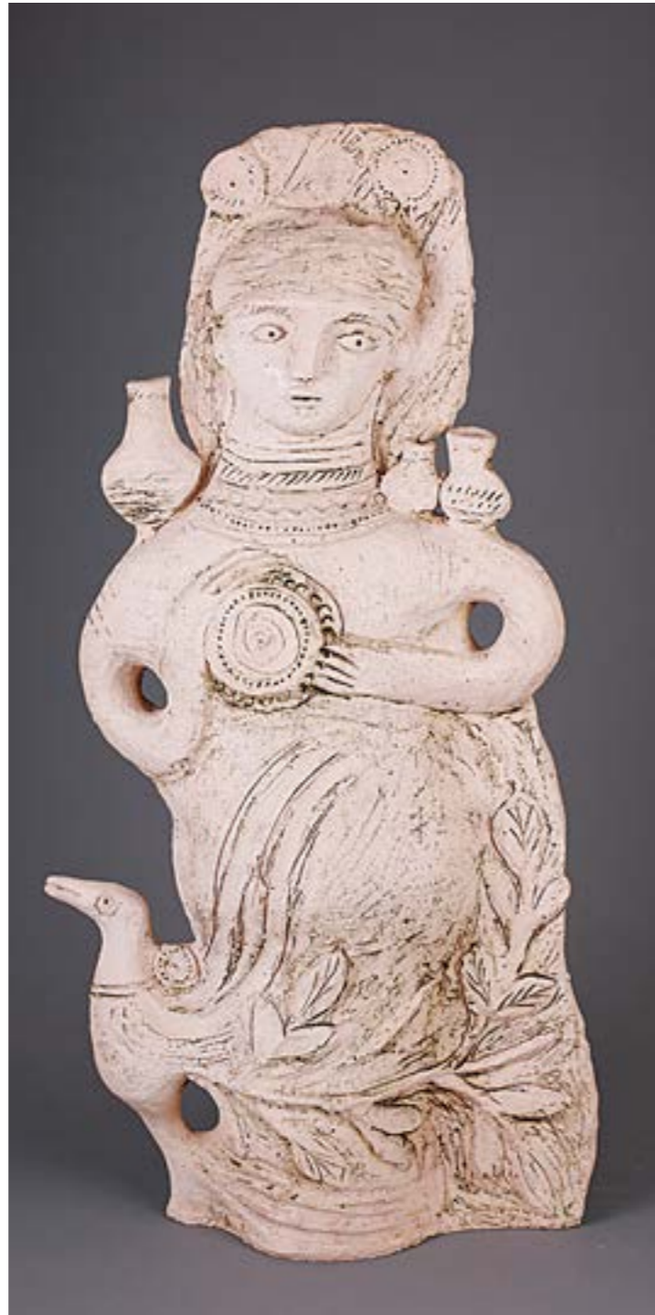
Юлія Козятник дипломна робота (фрагменти), шамот, полива, ліплення