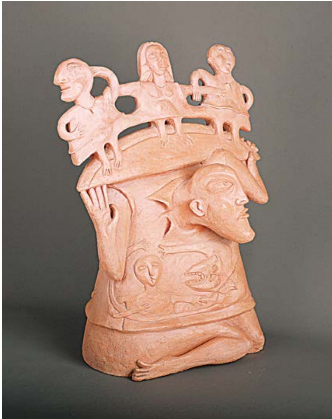
◀ ▶ Леся Костюк дипломна робота (фрагменти), глина, ліплення