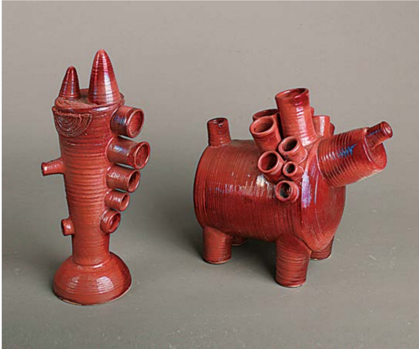
Валерія Залеська курсова робота (фрагменти), глина, поливи, гончарство, ліплення