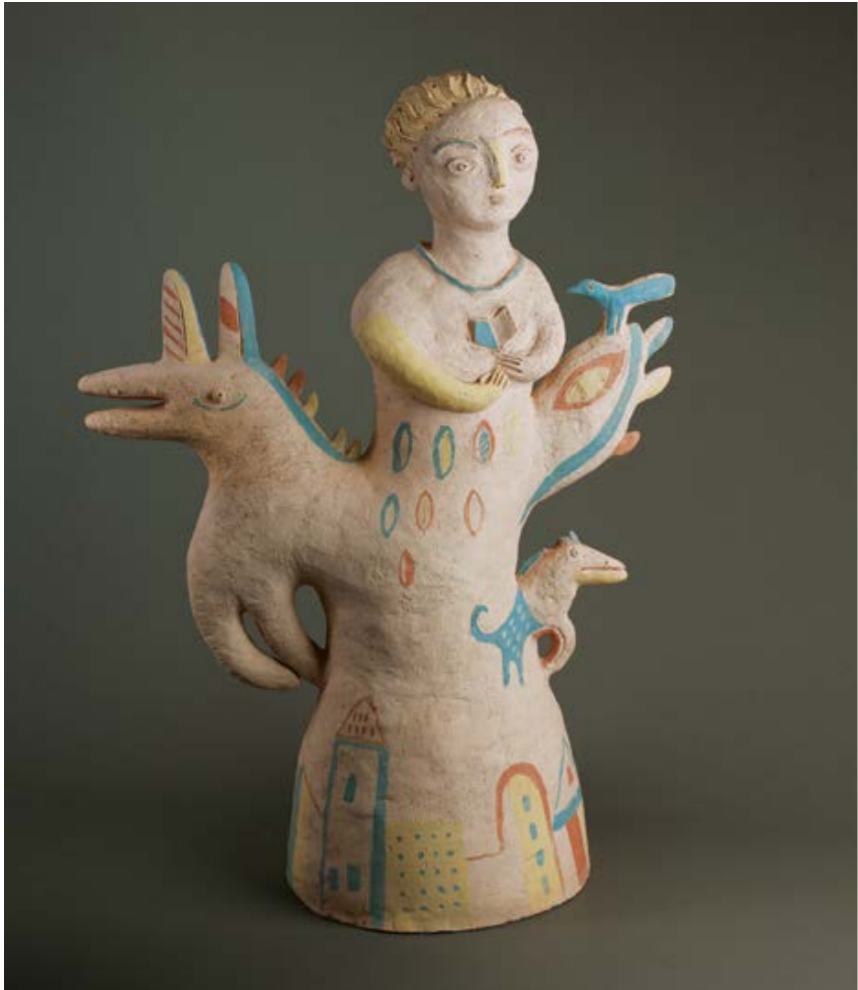
Ярослава Вереша дипломна робота (фрагменти), шамот, агоби, ліплення