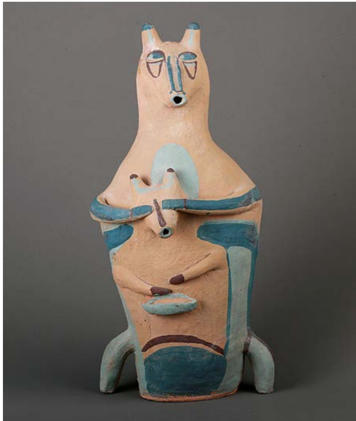
Юлія Козятник дипломна робота (фрагменти), шамот, агоби, ліплення