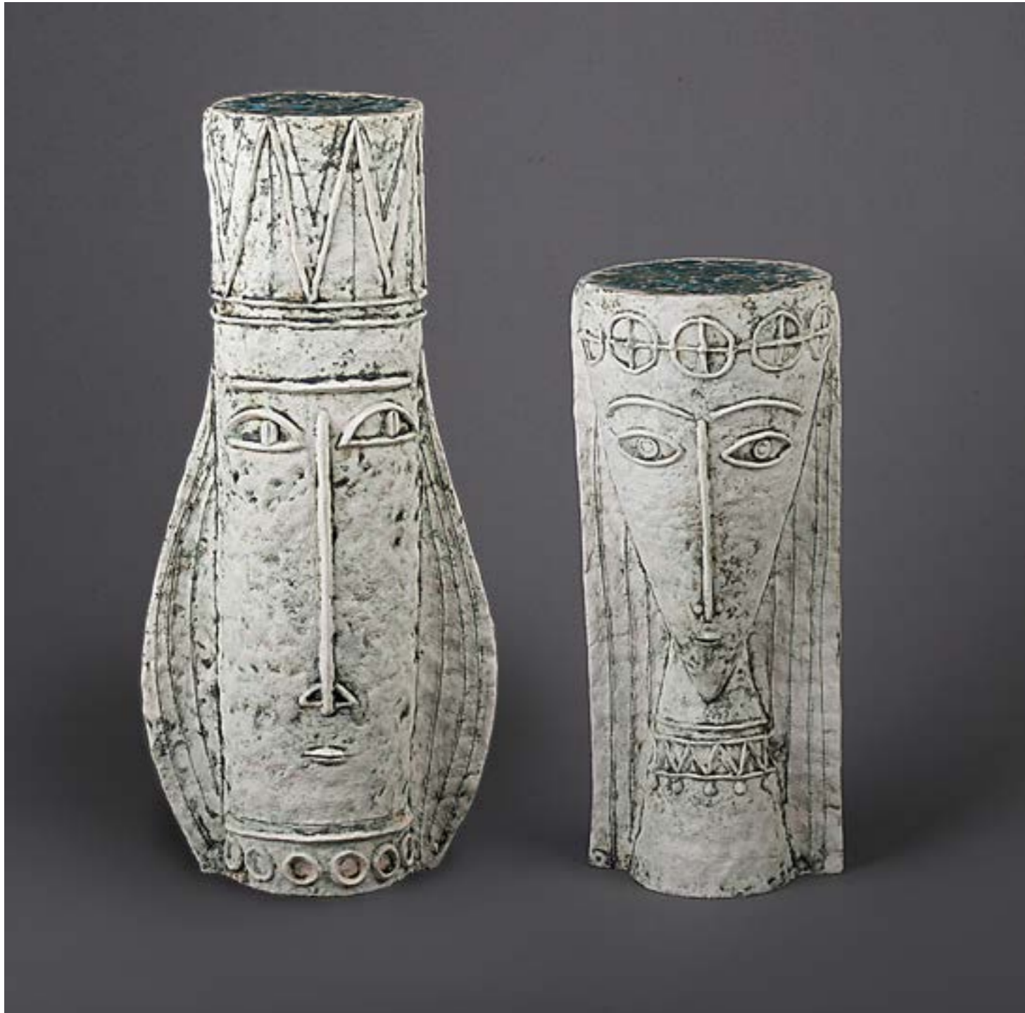
◀ ▶ Стефан Нагірняк курсва робота, шамот, поливи, ліплення