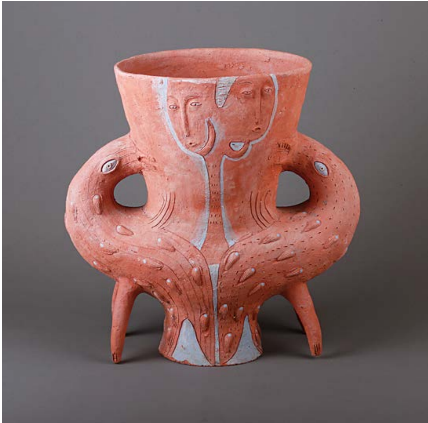
◀ Ярослава Вереша курсова робота, шамот, ангоби, ліплення