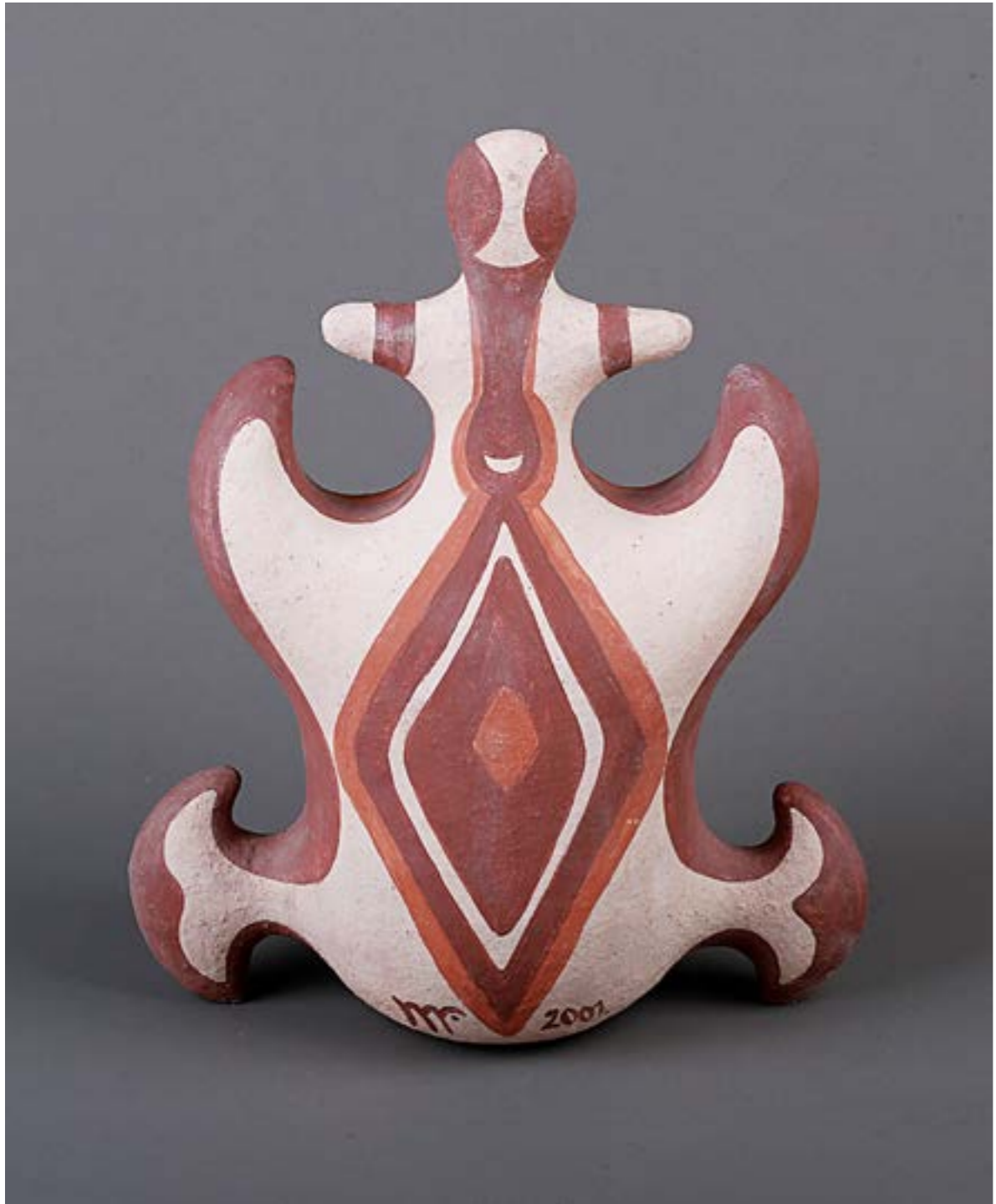
Лєся Горлова курсова робота, шамот, ангоби, ліплення