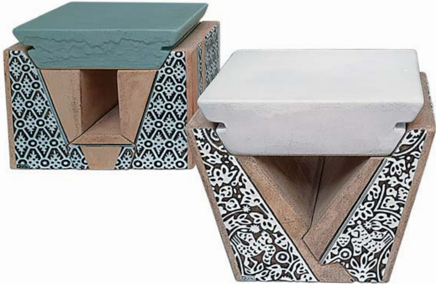
Аліна Окара дипломна робота, шамот, поливи, ліплення