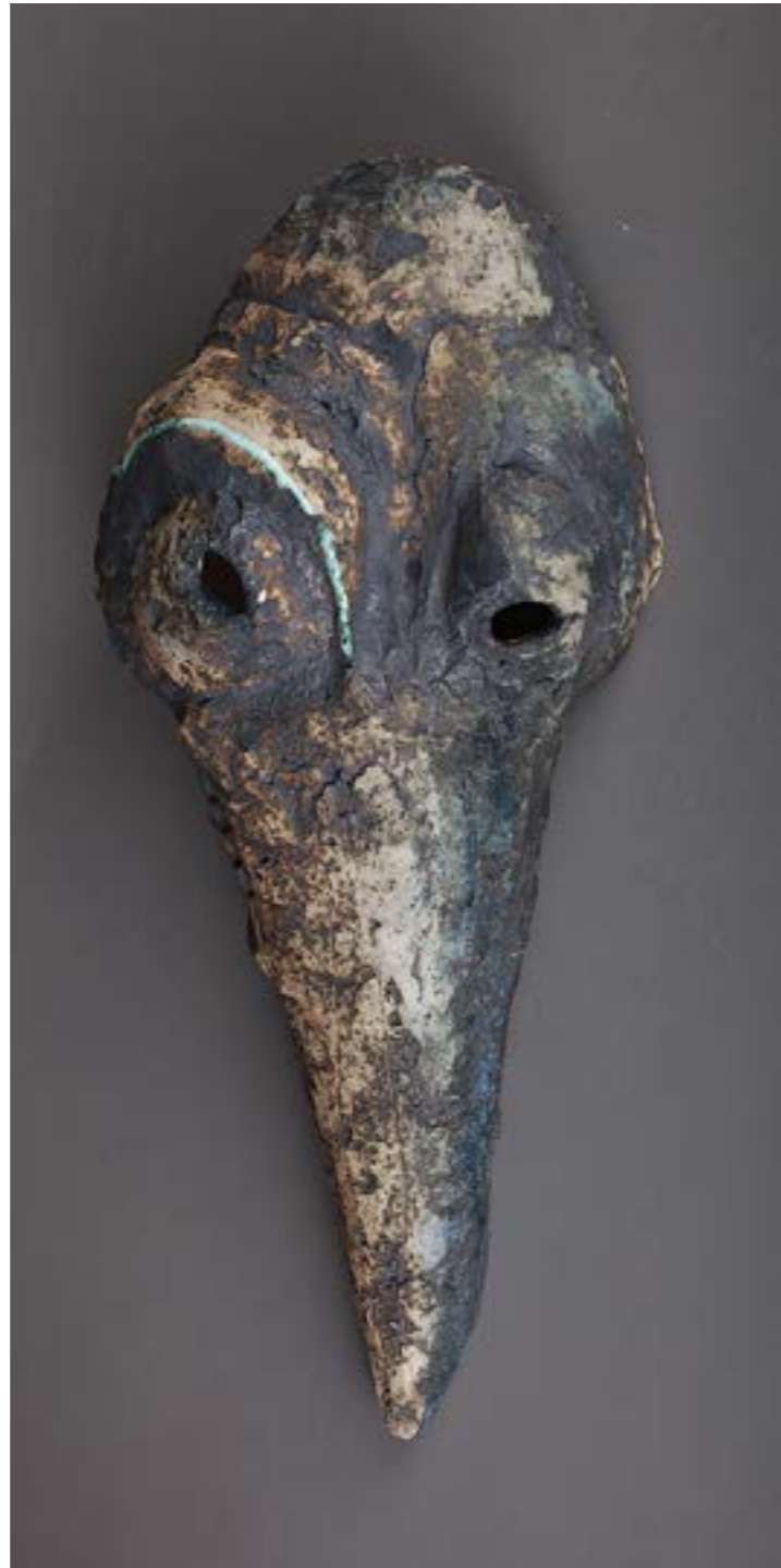
◀ ▶ Світлана Шоломіцька дипломна робота (фрагменти), шамот, поливи, ліплення