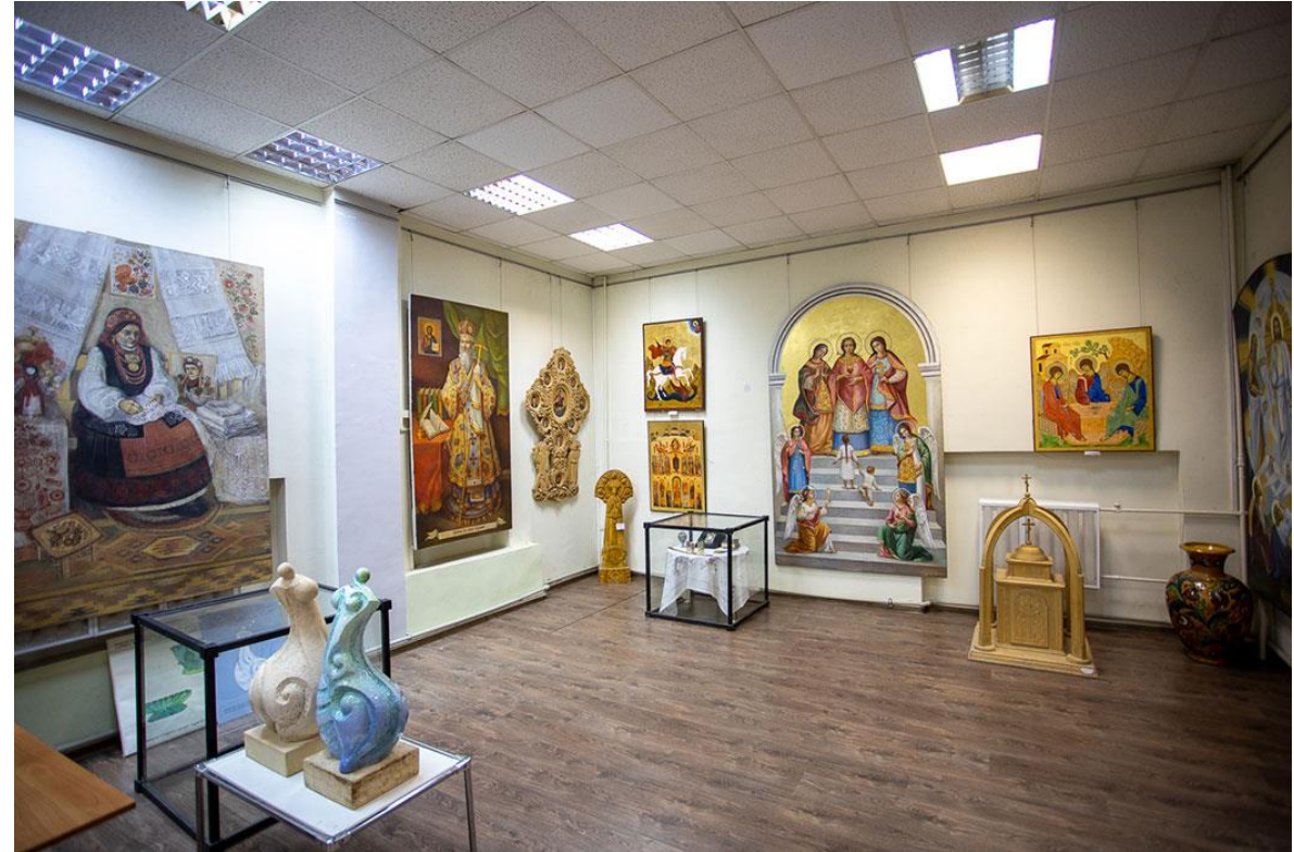
КАФЕДРА МИСТЕЦТВОЗНАВСТВА ТА МИСТЕЦЬКОЇ ОСВІТИ